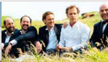
ON VOULAIT TOUT CASSER