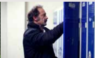
LA LOI DU MARCHÉ