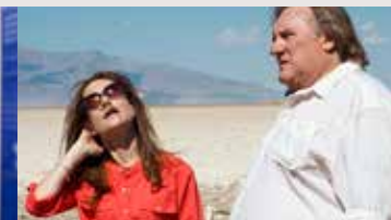
THE VALLEY OF LOVE