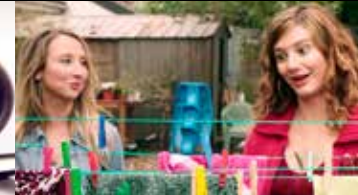
QUI C'EST LES PLUS FORTS