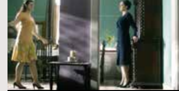
LA BELLE PROMISE

En Palestine, trois sœurs issues de l'aristocratie chrétienne ont perdu leur terre et leur statut social après la guerre des Six Jours de 1967 avec Israël. Incapables de faire face à leur nouvelle réalité, elles s'isolent du reste du monde en s'enfermant dans leur villa pour se raccrocher à leur vie passée. L'arrivée de leur