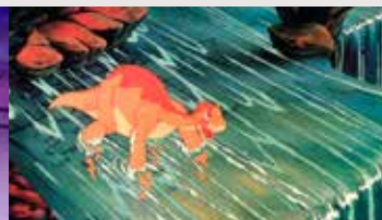
LE PETIT DINOSAURE...