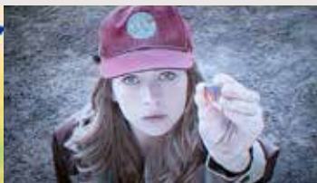
A LA POURSUITE DE DEMAIN