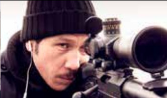
LA RÉSISTANCE DE L'AIR