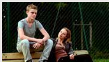
LA TÊTE HAUTE